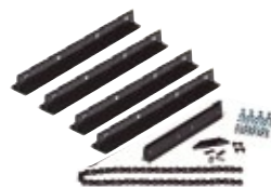
GDO3TKIT/ - 8

Extension de 1 metro de riel "t" para motores de garaje accessmatic cobra. incluye conector, cadena y riel de 1 metro de largo.